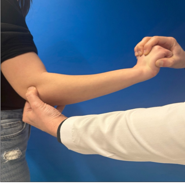
Şekil 3. Cozen testi gösterimi.

Tenis oyuncularının yarıya yakınında görülmektedir. Ayrıca ev hanımlarında, ağır yük taşıyan ve tekrarlayan kavrama kuvveti uygulayan meslek gruplarında sıklıkla görülmektedir.