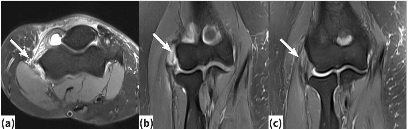
Şekil 2.a-c. Konservatif tedaviye refrakter lateral epikondilit MRG'leri. Aksiyel kesitte şiddetli ödem (a), koronal kesitte parsiyel yırtık görüntüsü (b), ortak ekstansör tendonda kalınlaşma (c) (beyaz ok).

Otuz beş-55 yaş aralığında pik yapar ve genellikle dominant kolda görülür. Çoğu olguda 6-12 ay içerisinde kendiliğinden düzelme eğilimi olmakla birlikte, bir grupta semptomlar kronikleşir ve fonksiyon kaybı gelişir. [2,3]